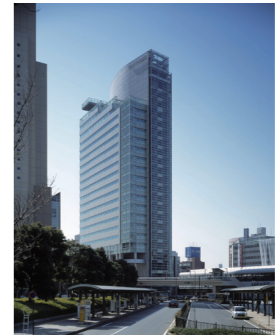
本社ビル(神奈川県横浜市):2004年落成