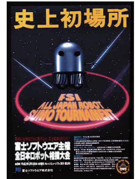
第1回全日本ロボット相撲大会®ポスター