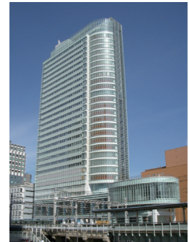
秋葉原ビル(東京都千代田区):2007年落成