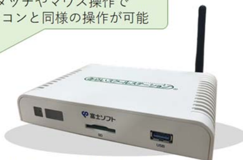
教育ICT専用端末『メディアボックス』